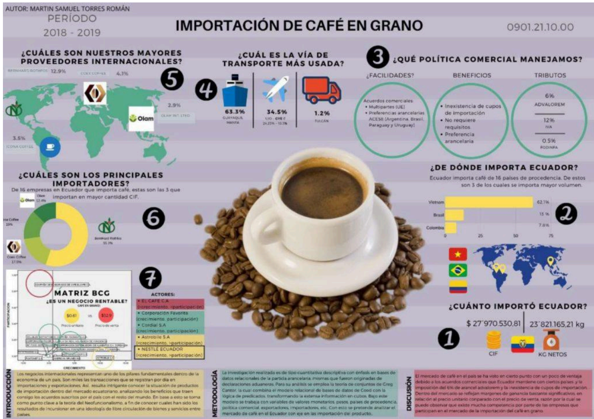
Café en grano