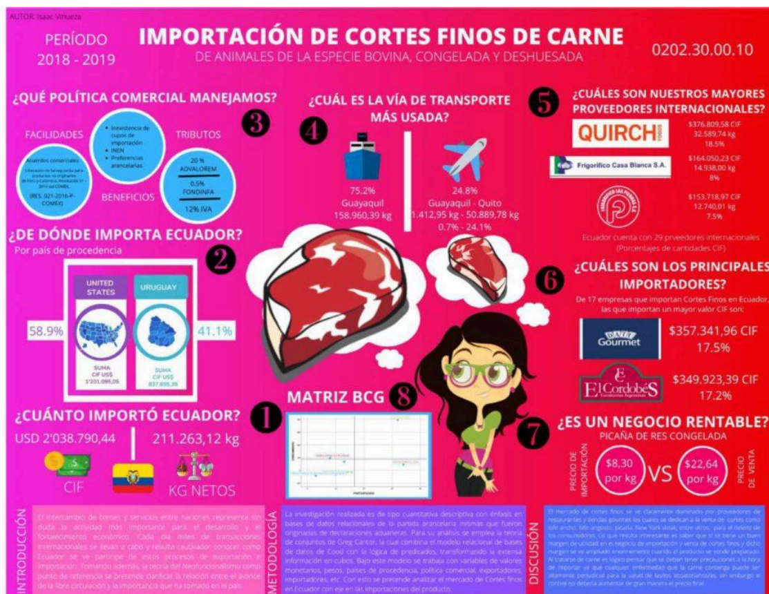
Cortes finos de carne