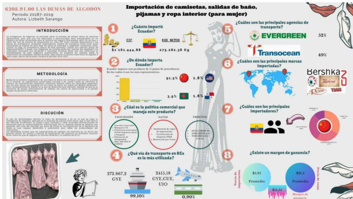
Camisetas, pijamas, salidas de baño, ropa interior