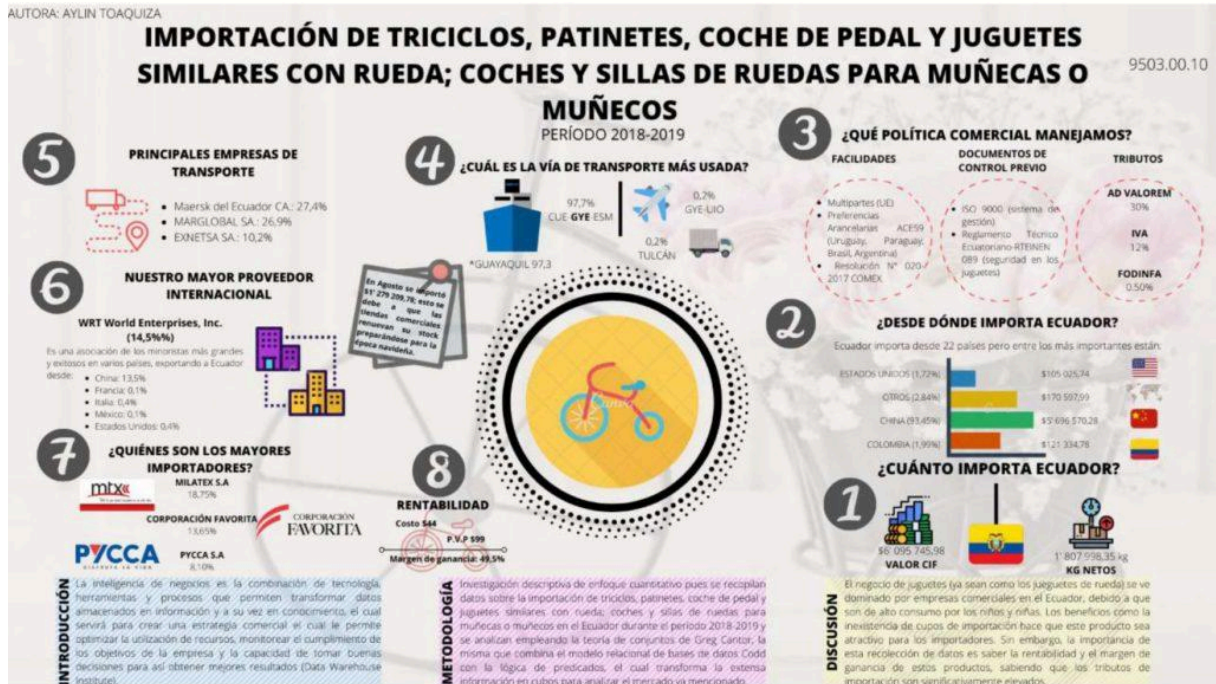
Triciclos, patinetes, coches de pedal