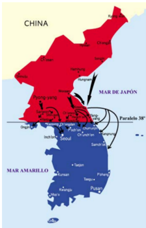
Junio de 1950, al iniciar el ataque del norte al sur.