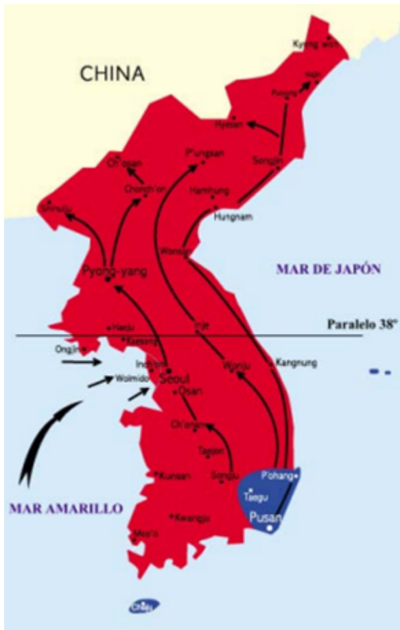
En septiembre de 1950, tras el desembarco de Incheon el sur recuperó territorio.