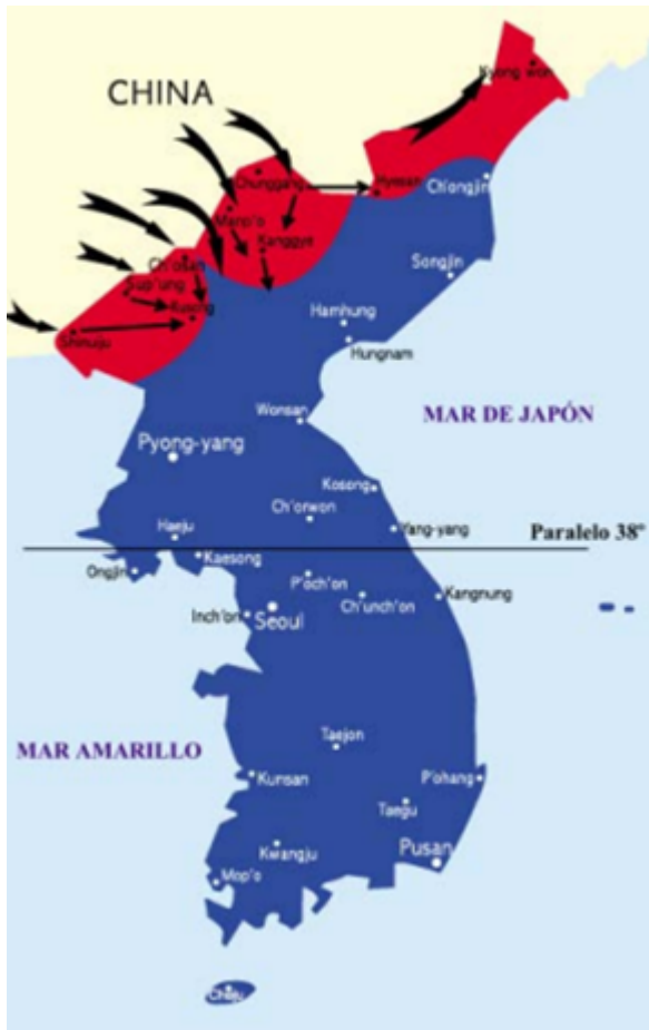
En noviembre de 1950, el sur estuvo a punto de tomar todo el territorio, China interviene.