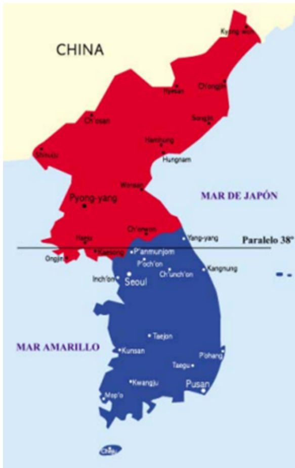
1953, después del armisticio, la división territorial casi